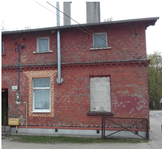
Fragment elewacji bocznej 1 - zdjęcie archiwalne